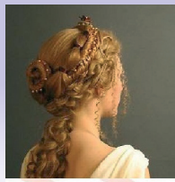
ΣΩΜΑΤΕΙΟ ΚΟΜΜΩΤΩΝ ΕΠΑΓΓΕΛΜΑΤΙΩΝ ΔΥΤΙΚΗΣ ΘΕΣΣΑΛΟΝΙΚΗΣ

από την ΚΑΛΛΙΤΕΧΝΙΚΗ ΟΜΑΔΑ του « ΣΩΜΑΤΕΙΟΥ ΚΟΜΜΩΤΩΝ ΔΥΤΙΚΗΣ ΘΕΣΣΑΛΟΝΙΚΗΣ »