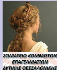
ΣΩΜΑΤΕΙΟ ΚΟΜΜΩΤΩΝ ΕΠΑΓΓΕΛΜΑΤΙΩΝ ΔΥΤΙΚΗΣ ΘΕΣΣΑΛΟΝΙΚΗΣ

HAPPENING ΛΗΞΗΣ ΣΥΝΕΔΡΙΟΥ BEAUTY MACEDONIA ΚΑΛΟΚΑΙΡΙ 2016 ΔΕΥΤΕΡΑ 30/5/2016 - 4.00μ.μ.